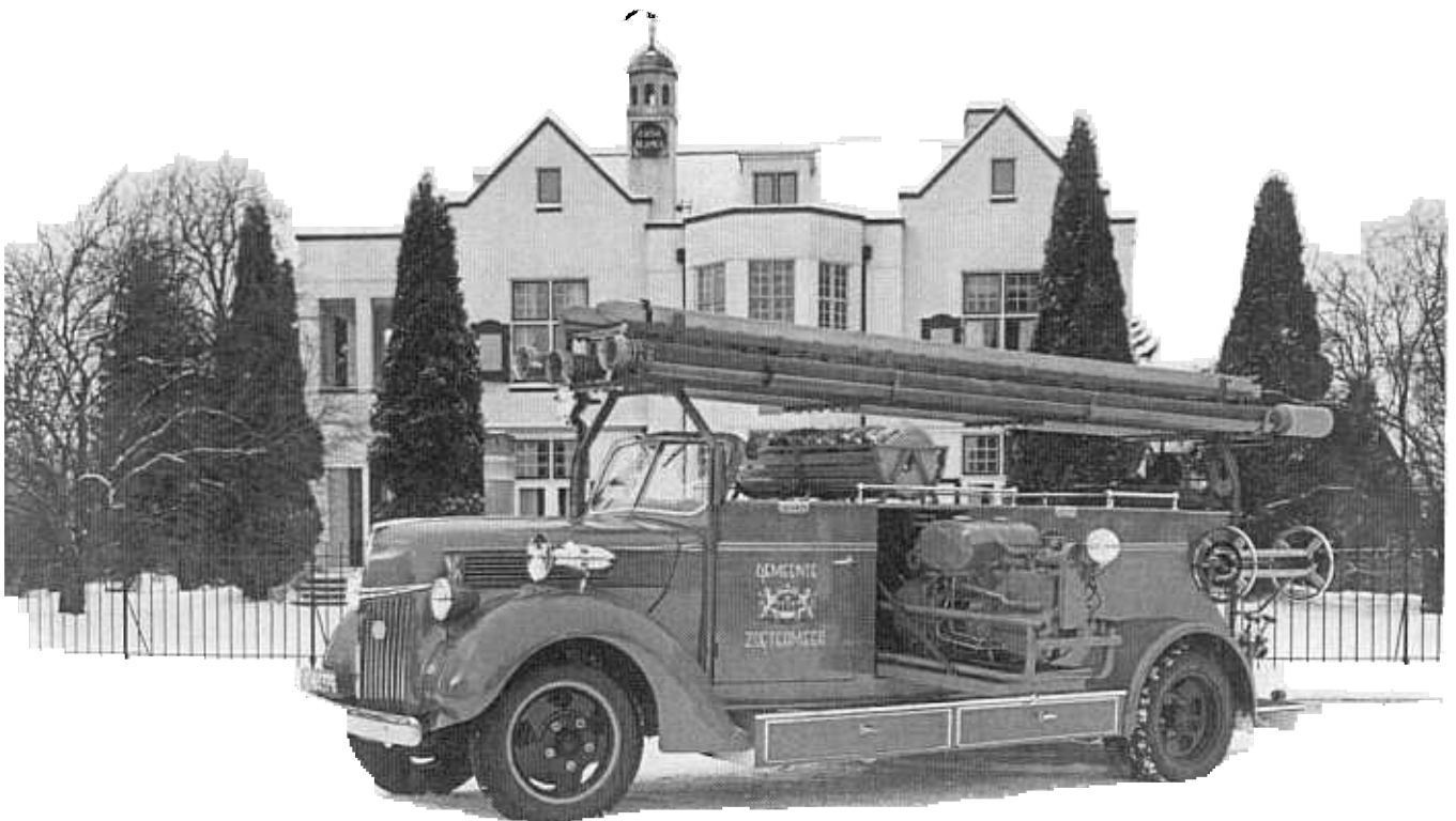
De automobielbrandspuit in een winterse omgeving gefotografeerd in Culemborg voor aflevering.

De opdracht voor de bouw van de eerste Zoetermeerse autospuit werd verstrekt aan de Fa. Gebr. Kronenburg Brandspuiten fabriek uit Culemborg, die voor het bedrag van fl.4950,- gulden een automobielbrandspuit en voor